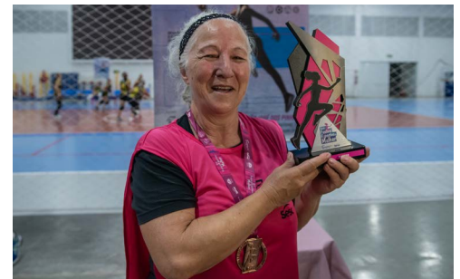
O vôlei de praia reuniu dez duplas de Curitiba e Região Metropolitana

promovendo a prática de diversas modalidades esportivas em um ambiente agradável, seguro e amistoso. Para este ano estão previstas edições em 27 unidades do Sesc PR. O Sesc de Maringá, Ivaiporã e Francisco Beltrão já realizaram o evento em 2022.