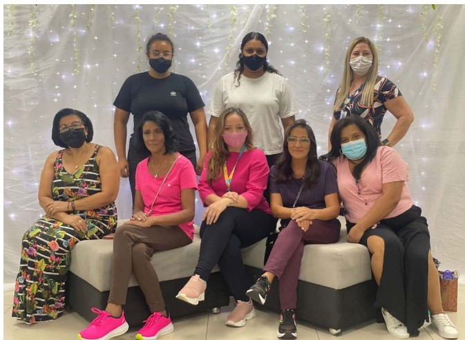
Dia de beleza realizado no Sesc e Senac Ponta Grossa, em parceria com a CMEG