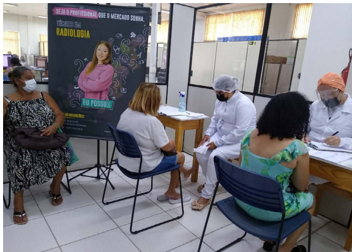
Ação realizada pelo Senac Umuarama na Agência do Trabalhador

PONTA GROSSA – Para celebrar o Dia Internacional da Mulher, o Sesc e Senac Ponta Grossa promoveram nesta terça-feira (8), em parceria com a Câmara da Mulher Gestora e Empreendedora de Negócios (CMEG), um dia de beleza para duas mulheres especiais, atendidas pelo projeto Casa da Sopa.