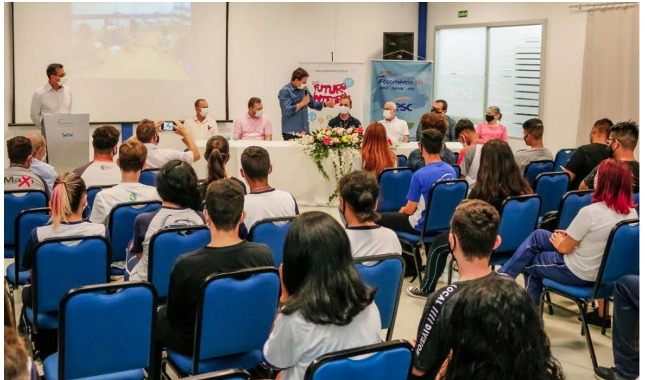
Aula inaugural do programa Portas Abertas - Pré-Aprendiz, parceria entre o Sesc Apucarana e a Prefeitura de Apucarana.

“Vocês estão em uma casa de excelência, que é o Sesc Apucarana. Aproveitem ao máximo este curso, contem sempre com a equipe da prefeitura e do Sesc e acreditem: cada um de vocês pode ser o que quiser