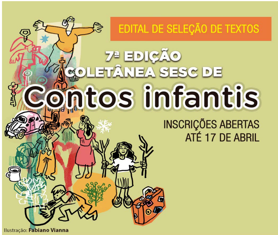
Ilustração: Fabiano Vianna

O edital para seleção de contos infantis compõe uma série de ações do Sesc PR para fomento à produção literária estadual, ao lado dos Laboratórios de Literatura e dos projetos desenvolvidos pela Rede Sesc de Bibliotecas do Sesc Paraná, do Arte da Palavra e da Semana Literária.