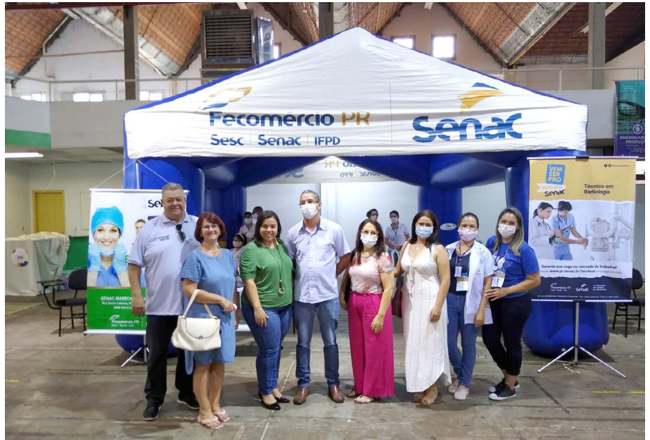
Senac Marechal Cândido Rondon no 1º Expo MEI e Feira do Emprego do município