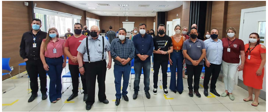
Equipe do Sesc e Senac União da Vitória e lideranças

“Neste ano conseguimos atingir públicos mais pontuais, o que favo-