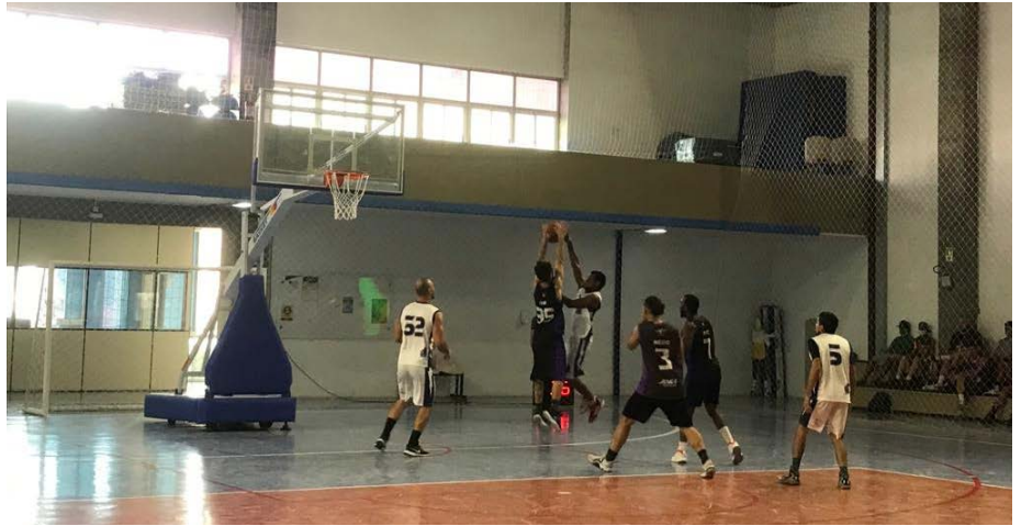
Basquete 3x3 realizado no Ginásio do Sesc da Esquina reuniu oito times da capital e da RM