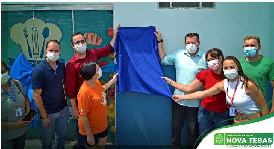
Reinauguração da Cozinha Escola no município de Nova Tebas

O Governo do Estado, por meio da Secretaria Estadual da Agricultura e do Abastecimento (Seab), destinou recursos de mais de R$60 mil. Com isso foi possível realizar reformas estruturais e fazer a aquisição de novos equipamentos: fornos e batedeiras industriais, câmara fria para conservação dos ingredientes, novos fogões, geladeira em tamanho grande e mesas de inox para o preparo adequado dos alimentos, entre outros utensílios que serão usados durante as aulas.