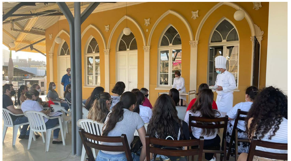
Semana de Qualificação Profissional na unidade Sesc Estação Saudade