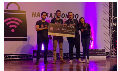
Equipe VRUM (3º lugar)