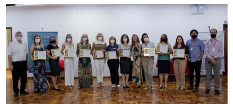
CMEG Marechal Cândido Rondon