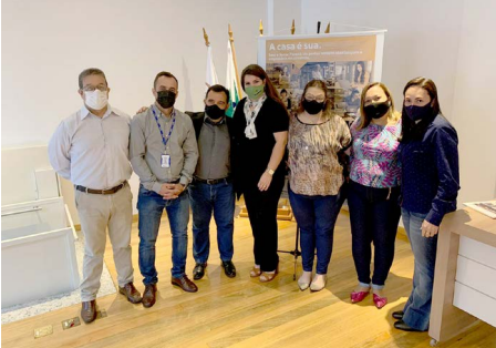
CMEG Jacarezinho e Cambará