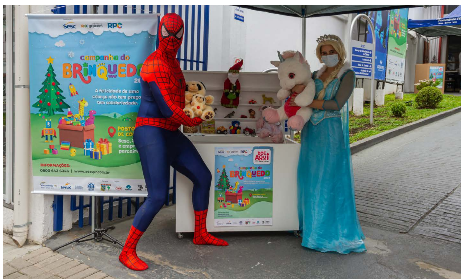
Personagens do universo infantil receberam as doações no Sesc Água Verde