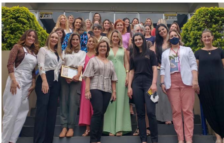
CMEG Francisco Beltrão