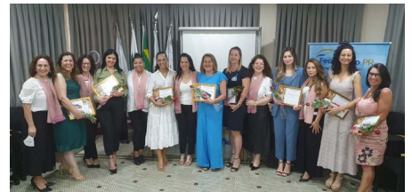
CMEG Foz do Iguaçu