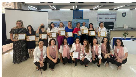
CMEG Foz do Iguaçu