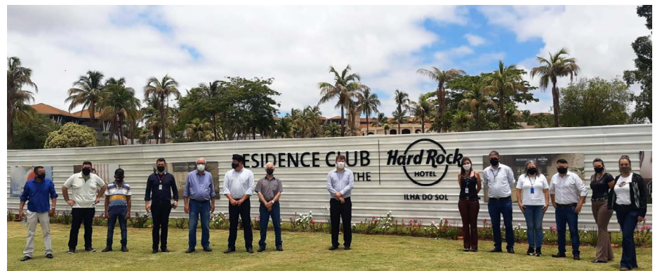
Visita às futuras instalações do Hard Rock Hotel Ilha do Sol

técnicas às futuras instalações do Hard Rock Hotel Ilha do Sol, que será inaugurado em 2022 no município de Sertaneja, e para o qual o Senac está qualificando profissionais em diversas áreas, por meio de convênio com Prefeitura. O imponente hotel está