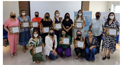
CMEG Cornélio Procópio