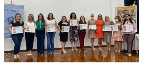
CMEG Campo Mourão