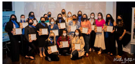
CMEG Ponta Grossa