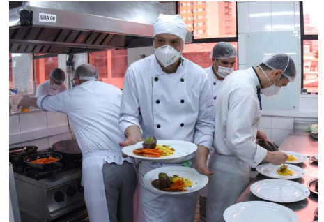
Projeto integrador de Cozinheiro apresenta cardápio com insumos paranaenses