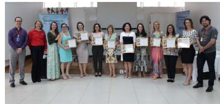
CMEG Marechal Cândido Rondon