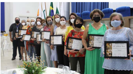
CMEG Campo Mourão