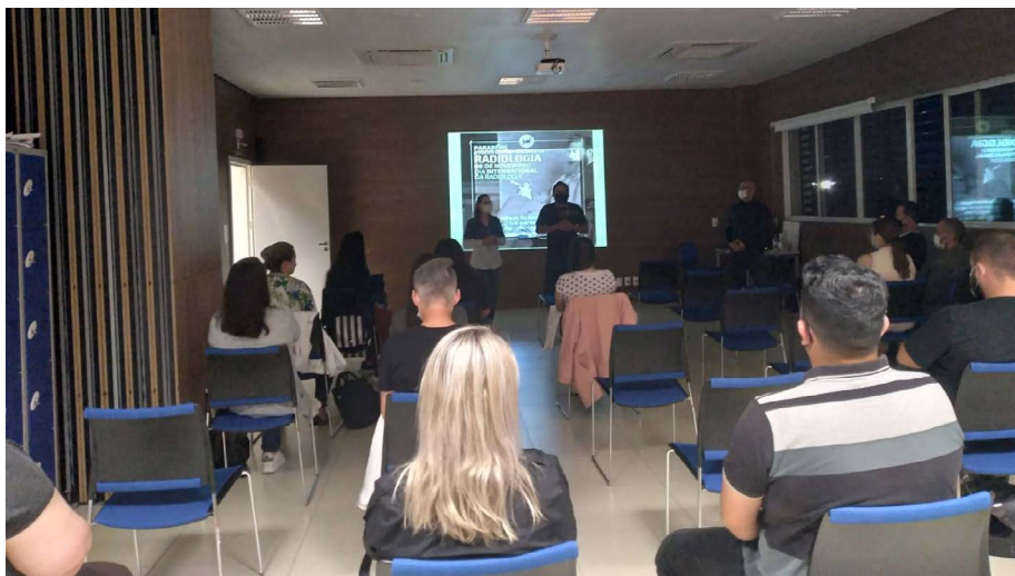
Primeira Semana de Radiologia realizada pelo Senac Rio Negro