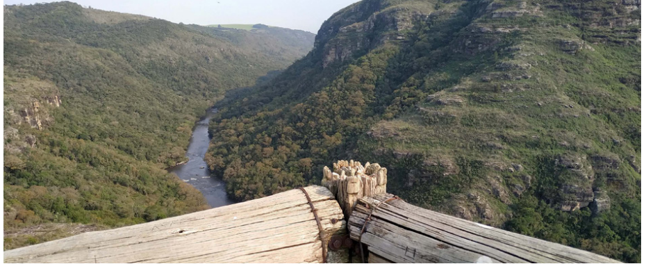
Parque Estadual do Guartelá.

De acordo com o diretor de Patrimônio Natural do IAT, Rafael Andreguetto, para fazer parte do projeto de parcerias, é preciso ter um atrativo mínimo de infraestrutura. “Hoje o ecoturismo e o turismo de aventura bem coordenados e planejados são instrumentos para a conservação da biodiversidade em um Estado com