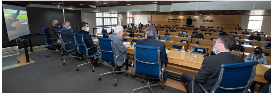
Os detalhes da proposta de concessão do Parque Estadual do Guartelá, em Tibagi, foram apresentados em roadshow realizado na sede da Fecomércio PR, em Curitiba