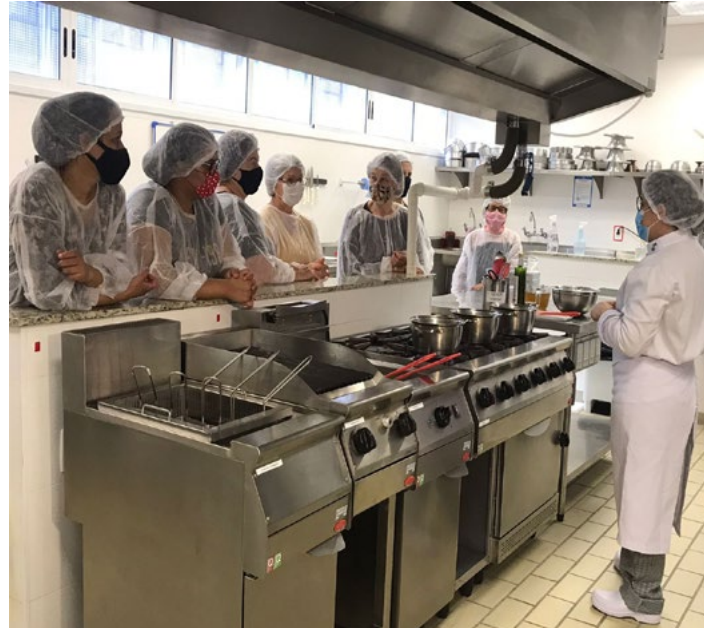
Oficina de Culinária Afetiva oferecida pelo Senac

Desde o início da semana unidas do Sesc e do Senac de todo o estado pensaram em uma programação especial para celebrar o Dia do Comerciante, comemorado em 30 de outubro. Em São José dos Pinhais a unidade integrada promoveu diversas atividades gratuitas para comemorar a data, sendo um convite para os trabalhadores do comércio conhecerem as instalações e os serviços disponibilizados pelo Sesc e pelo Senac.