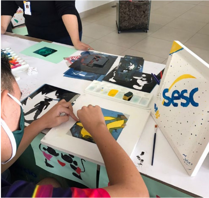
Oficina de estêncil promovida pelo Sesc