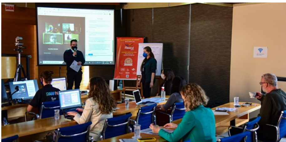
Workshop aconteceu na plenária da Fecomércio PR de forma híbrida