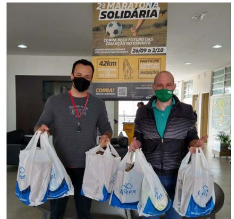
Entrega de pares de tênis no Sesc Pato Branco

As atividades são gratuitas e os alunos recebem lanches em todas as aulas, além da camiseta do uniforme no momento da matrícula. Em Curitiba e Almirante Tamandaré, o programa é desenvolvido em parceria com as Prefeituras e é realizado em 16 praças e parques públicos localizados