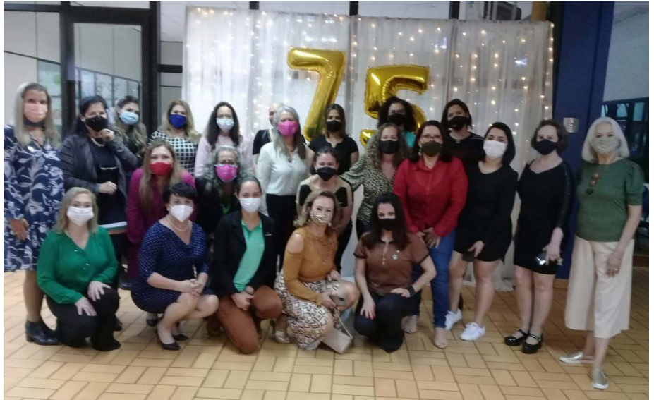
A entidade empresarial feminina durante o café colonial comemorativo aos 75 anos do Sesc

“Nós, mulheres, estamos sempre em movimento. Jamais nos deixamos vencer pelas crises, seja no comércio ou no cotidiano particular”, comentou a presidente.