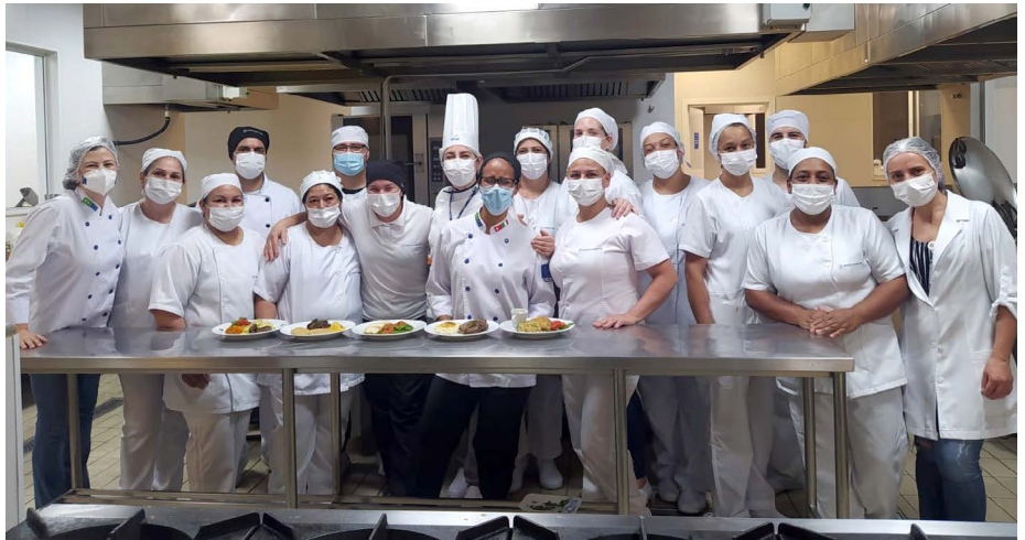
Equipe de cozinha do Hospital Erasto Gaertner durante o curso do Senac

“Com esse curso percebemos que a gastronomia hospital está cada vez mais presente em nosso hospital e isso só trará benefícios na recuperação de nossos pacientes. Comida de hospital não pode ser sinônimo de comida sem graça. Nós temos que inovar cada vez mais, buscando contribuir com o tratamento do paciente”, afirma. Ela completa: “A alimentação é uma função essencial, mas também é um