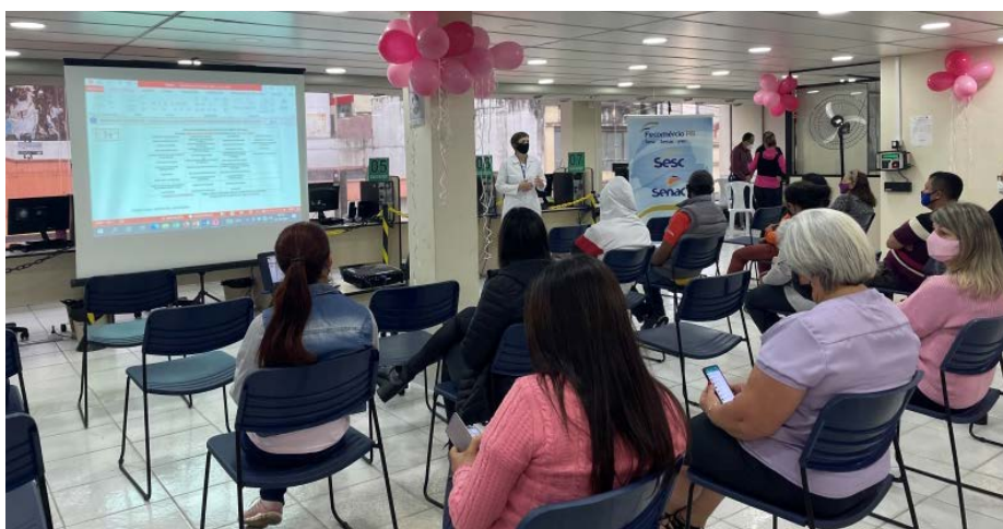
Ação realizada na sede da Agência do Trabalhador de Ponta Grossa