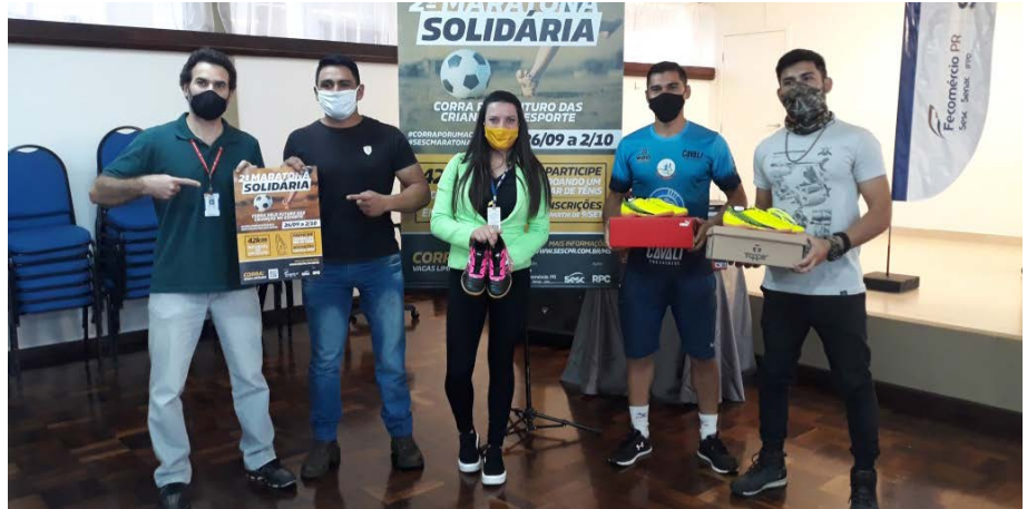
Entrega dos pares de tênis para a inscrição da 2ª Maratona Solidária no Sesc Ponta Grossa

As doações, que ainda estão sendo recolhidas e contabilizadas, serão destinadas àqueles alunos em situação de maior vulnerabilidade social. Um evento simultâneo será realizado em cada uma das unidades de serviço do Sesc PR que desenvolvem o projeto Aprender & Jogar. “O Sesc Paraná agradece imensamente a todos que