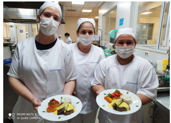
Participantes exibem orgulhosos os novos pratos que aprenderam a preparar durante o curso do Senac

ato de amor, um ato social, vinculado aos costumes, cultura, religião, condição clínica, entre outros. A gastronomia hospitalar, aliada à prescrição dietética, deve respeitar estas situações, garantindo ao paciente o aporte de nutrientes necessários, tornando as refeições mais atrativas e saborosas, contribuindo