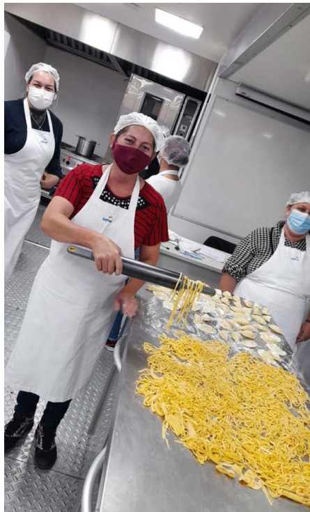
As alunas literalmente colocaram a mão na massa durante o curso de Preparo de Massas Frescas e Recheadas