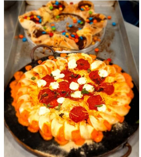
Algumas das delícias que os participantes do curso de Preparo de Massas Frescas e Recheadas aprenderam

Os cursos da Unidade Móvel de Pães e Confeitos do Senac são viabilizados através de convênio com a Secretaria de Assistência Social de Imbituva. Ao longo da estada da