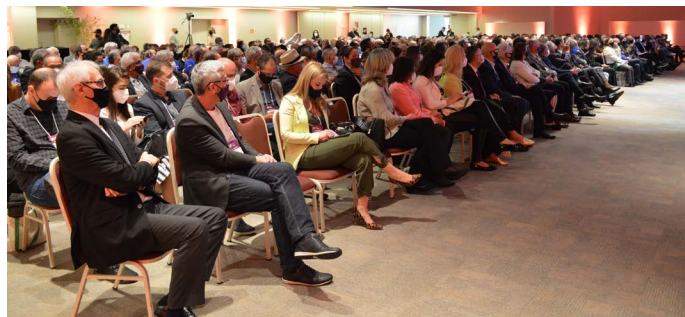
Palestra magna “Trabalho no Pós-Pandemia” com o ministro do Trabalho e Previdência, Onyx Lorenzoni

A palestra magna “Trabalho no Pós-Pandemia” com o Ministro do Trabalho e Previdência, Onyx Lorenzoni, foi o destaque desta manhã de quinta-feira (30), dentro da programação do 36º CNSE (Congresso Nacional de Sindicatos Empresariais). Após a palestra, o ministro foi recebido pelo presidente da Fecomércio-RS, Luiz Carlos Bohn, que na ocasião também estava representando a Confederação Nacional do Comércio (CNC), por presidentes de Federações de outros estados e por representantes de sindicatos de todo país, para debater os desafios do setor do comércio de bens, serviços e turismo.