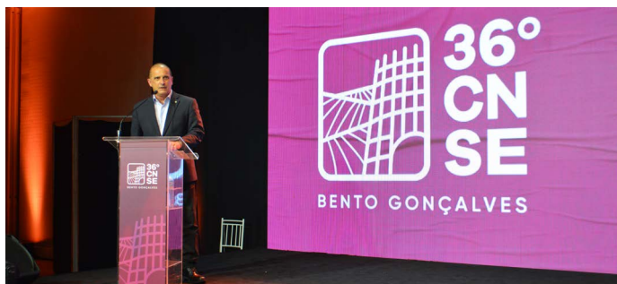
O ministro do Trabalho e Previdência, Onyx Lorenzoni