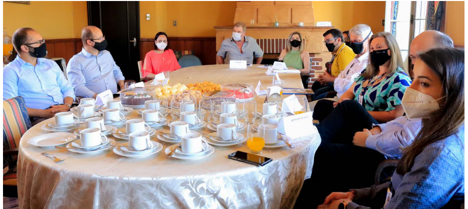
O encontro aconteceu na sala de reuniões do Palácio do Diamante, sede da Prefeitura Municipal de Tibagi