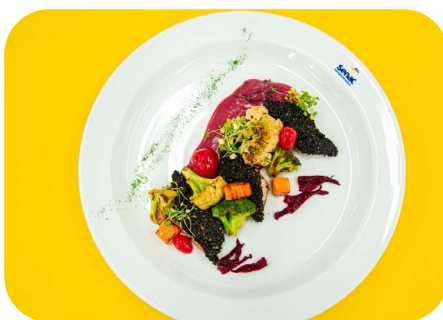
Prato principal: Tilápia na crosta de gergelim e molho velouté de hibisco com legumes