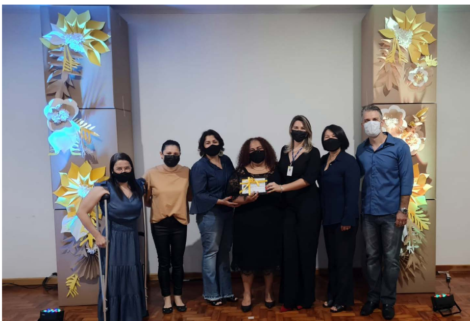
Colaboradores do Sesc Paranaíba com mais de dez anos de casa