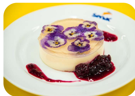
Sobremesa: Cheesecake de amor-perfeito e calda de flores e frutas vermelhas