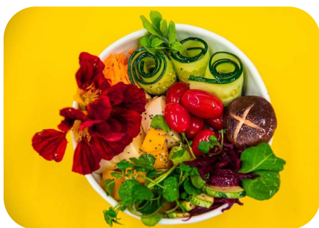
Entrada: Salada de folhas, frutas e legumes com flores de capuchinha e conserva de vinagreira