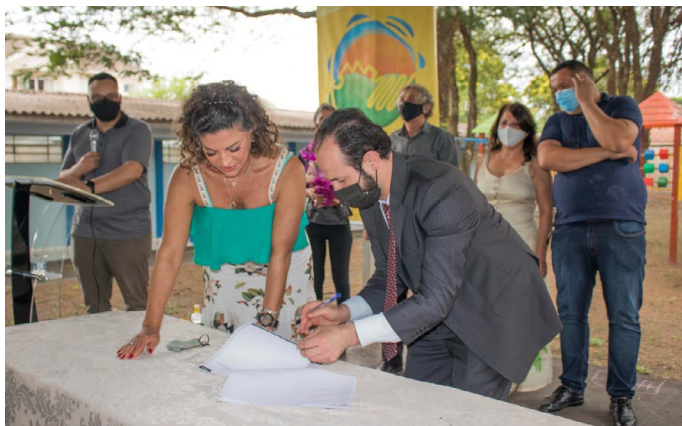
Assinatura do termo de cooperação entre o prefeito de Sarandi, Walter Volpato, e pela desembargadora do Tribunal de Justiça do Estado do Paraná (TJPR), Joeci Machado Camargo, coordenadora do Justiça no Bairro