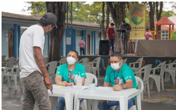
Atendimentos serão feitos no município até o dia 18 de setembro, mediante agendamentos

Um termo de cooperação técnica entre a Prefeitura de Sarandi e o Programa Justiça no Bairro foi assinado na manhã de ontem (14), dando início aos atendimentos do projeto no município. Até sábado (18), a população local será beneficiada com os serviços jurídicos e sociais do Programa, com atendimentos das 9h às 17h30, na Escola Municipal Mauro Padilha, mediante pautas agendadas pela Secretaria Municipal de Assistência Social.