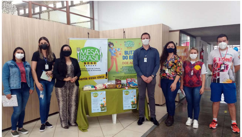
Equipe do Sesc Guarapuava

Cerca de 30 crianças serão atendidas semanalmente e participarão de oficinas de recreação, ensino de Língua Portuguesa, imersão no universo literário, contação de histórias, entre outras.