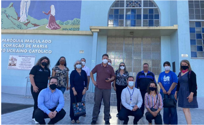
Igreja Imaculado Coração de Maria