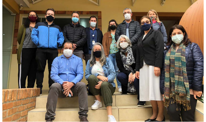
Museu das Irmãs Servas da Misericórdia – Prudentópolis

O Grupo de Trabalho (GT) de Turismo Religioso Paraná visitou Irati e Prudentópolis, nos dias 1 e 2 de setembro, para o pré-lançamento da Rota da Medalha Milagrosa. A proposta é a criação de um roteiro de Turismo Religioso integrado entre as duas cidades, em que a devoção e a vivência histórica nos atrativos sejam destaques.