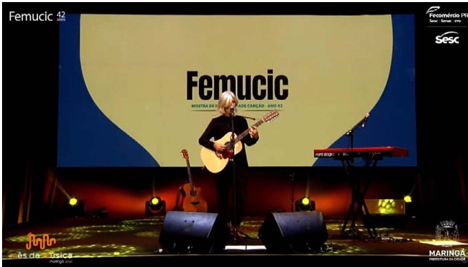
Live com o cantor Oswaldo Montenegro