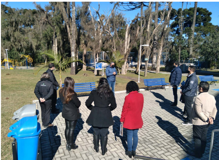
Encontro realizado em alusão ao Mês do Comerciante pelas unidades