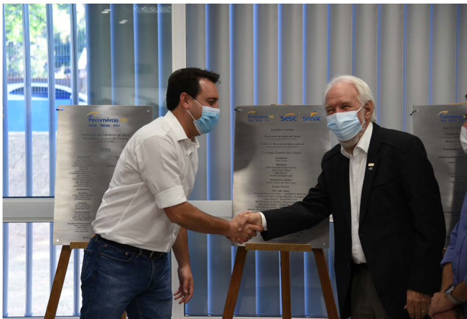
O governador Carlos Massa Ratinho Junior e o presidente do Sistema Fecomércio Sesc Senac PR e vice-governador, Darci Piana, durante o descerramento das placas inaugurais

O Sesc abriga em sua área externa um campo de futebol de grama sintética com vestiários, academia ao ar livre, anfiteatro descoberto e pista de caminhada. Já na área construída de 1.289,51 m 2 se encontram o CineSesc com 59 poltronas e espaço para cadeirante, biblioteca, sala de cursos de valorização social e artes, sala de cursos diversos, academia de ginástica multifuncional, pilates, vestiários, incluindo vestiário acessível, área administrativa e de apoio. “Temos a convicção que o investimento feito nessa unidade trará benefícios sociais