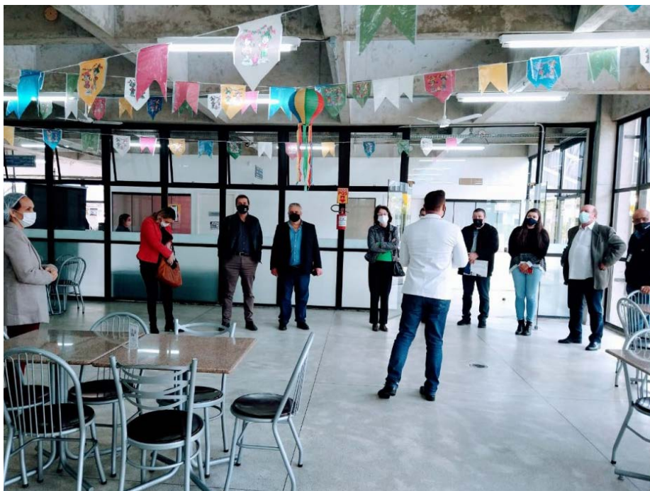
Encontro com os empresários realizado pela unidade

Os convidados receberam uma chave simbólica da unidade e, ao final do evento, realizaram uma visita pelos espaços do Sesc Paranaguá.