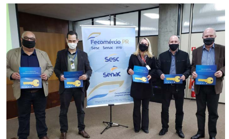
Ações realizadas em alusão ao Dia do Comerciante pela unidade