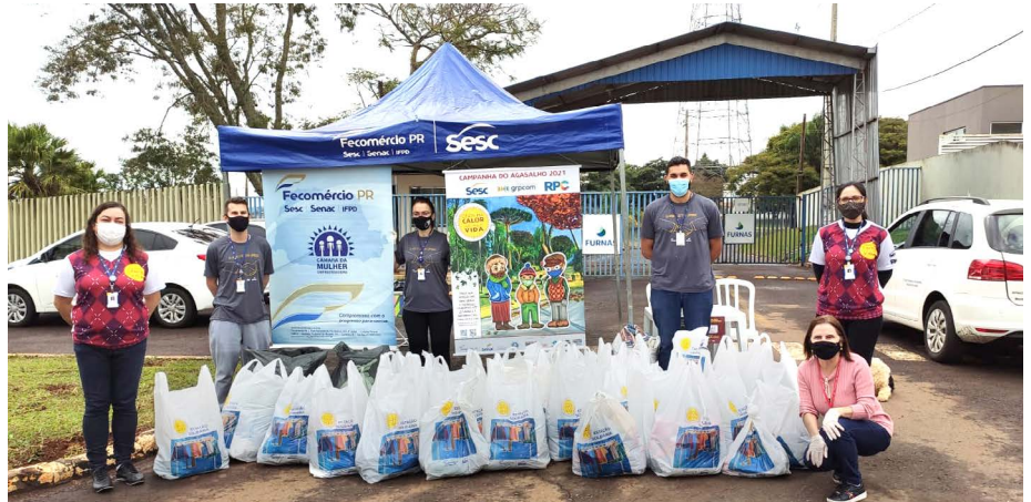
Ivaiporã foi uma das 26 cidades que realizou a arrecadação de doações

A campanha teve início em maio deste ano e segue até o dia 27 de agosto. Já foram doadas mais de 450 mil itens, 204 instituições foram atendidas e 67.234 pessoas beneficiadas.