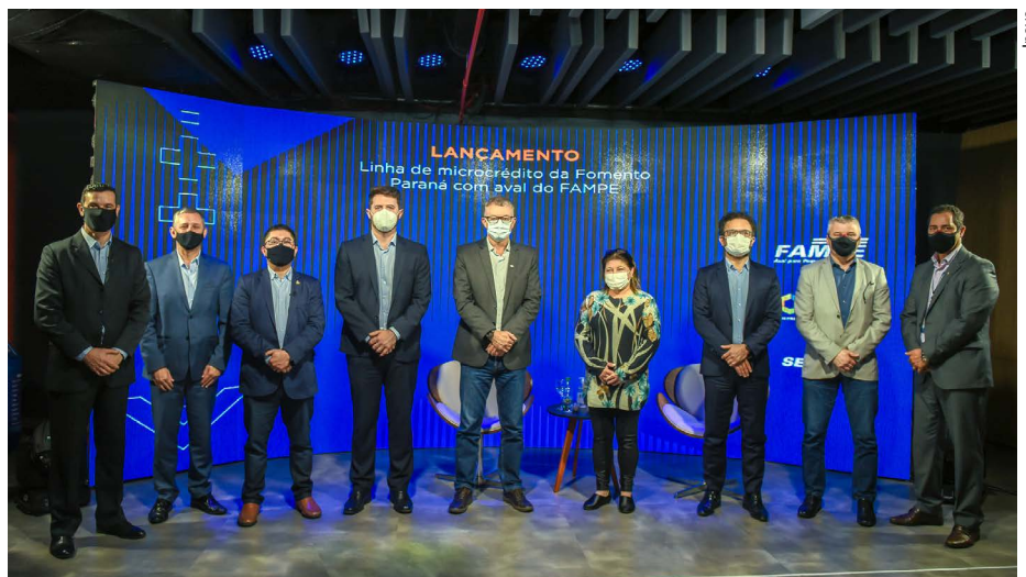
Lançamento da parceria entre o Sebrae/PR e a Fomento Paraná para o uso do Fampe aconteceu nessa quinta-feira (15)

A Fomento estima que mais de 4,5 mil negócios poderão ser beneficiados e que até R$ 48 milhões em operações de microcrédito poderão ser contratados.