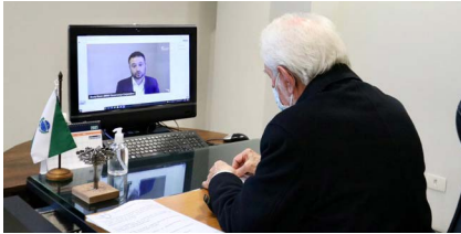
Presidente do Sistema Fecomércio Sesc Senac PR e vice-governador do Paraná, Darci Piana, assistindo ao treinamento de LGPD