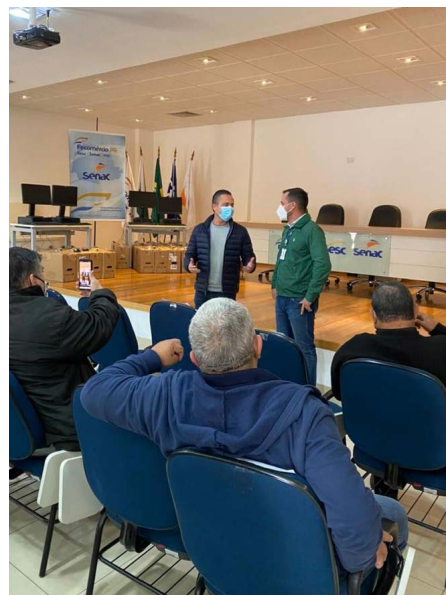
Momento da entrega no auditório do Senac Jacarezinho