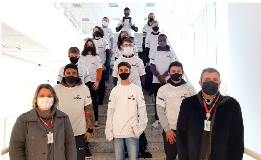
Aprendizes da primeira turma do programa Melhor Aprendiz Tech do Senac Pato Branco

O Melhor Aprendiz Tech é um programa gratuito para as empresas contribuintes do Senac que garante formação profissional aos alunos e auxilia as empresas com a demanda de contratação nessa área.