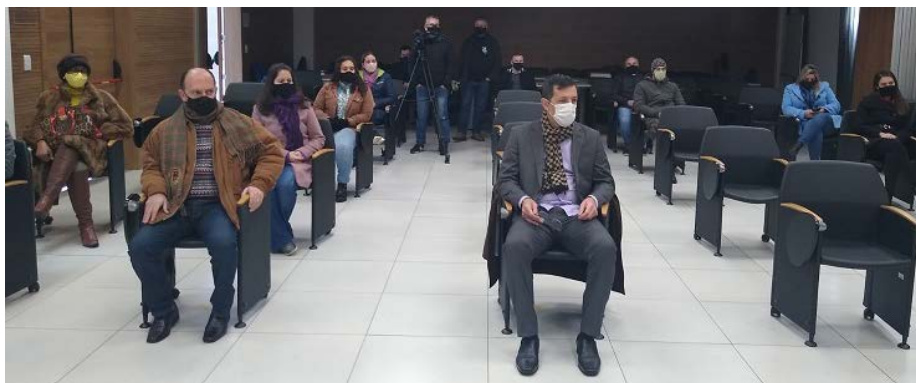
Abertura da primeira turma realizada em convênio com a Prefeitura de Pato Branco

“Estamos investindo no futuro de todos os pato-branquenses. Dar essa oportunidade aos nossos jovens possibilita que eles saiam com certificado e já atuando em empresas da área. A tecnologia está praticamente em tudo no nosso cotidiano e o nosso objetivo é estimular e fazer esta área crescer cada vez mais”, destaca o prefeito de Pato Branco, Robson Cantu.