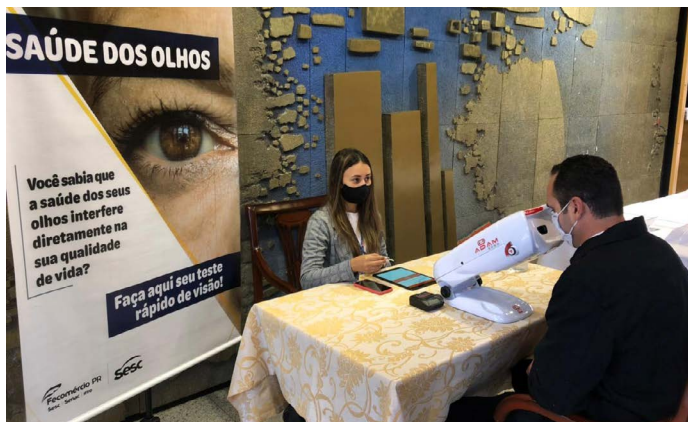
Teste de acuidade realizado na Administração Regional do Sesc PR