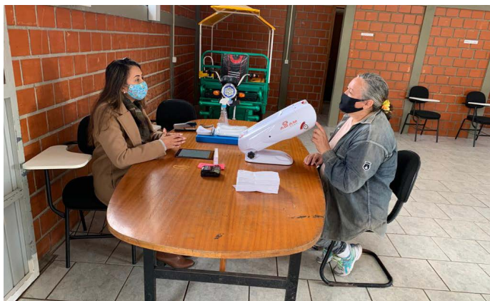
Ação com o Adam Robô na Ceasa

Nos dias 24 e 25 de junho a Gerência de Saúde e Odontologia do Sesc PR realizou duas ações voltadas à Campanha de Saúde dos Olhos. O Adam Robô – equipamento de última geração que realiza testes rápidos de visão em apenas cinco minutos, foi adquirido em 2020 pelo Sesc PR e tem sido utilizado pelas ações de Educação em Saúde, tanto nas unidades de serviço do Sesc PR como em empresas, com o objetivo de ampliar e melhorar o acesso à saúde oftalmológica dos clientes, facilitando a prevenção e identificação precoce de alterações oculares.