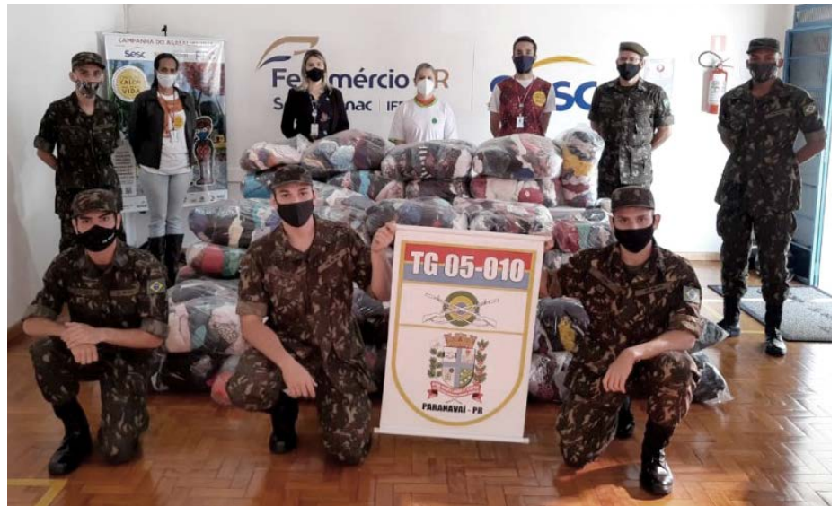
Doação feita pelo Sesc de Paranavai para o GOES – Grupo Gotas de Esperança

Para garantir o cuidado com a saúde e minimizar a propagação da Covid-19 são tomadas todas as medidas de segurança e higiene. Assim como na edição passada, as doações