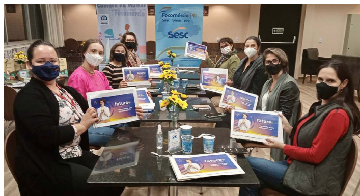
Reunião de alinhamento do programa Fature+ com representantes da unidade Senac Francisco Beltrão e da Câmara da Mulher Empreendedora e Gestora de Negócios de Francisco Beltrão (CMEG)

No último sábado (12) o Senac Cataratas preparou um café para sindicatos e empresários da cidade com o objetivo de apresentar o programa Fature+, desenvolvido pelo Sebrae PR em parceria com o Sistema Fecomércio Sesc Senac PR.