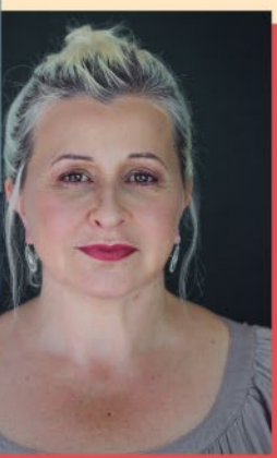
Céu (São Paulo-SP)