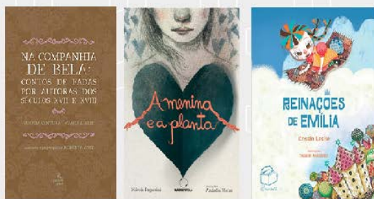
LIVROS DO BATE-PAPO | SÁBADO, 24/4