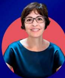
Tania Mine Trade Design