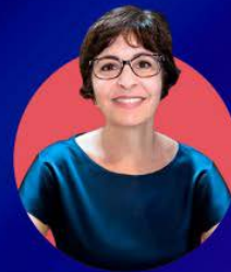
Tania Mine Trade Design