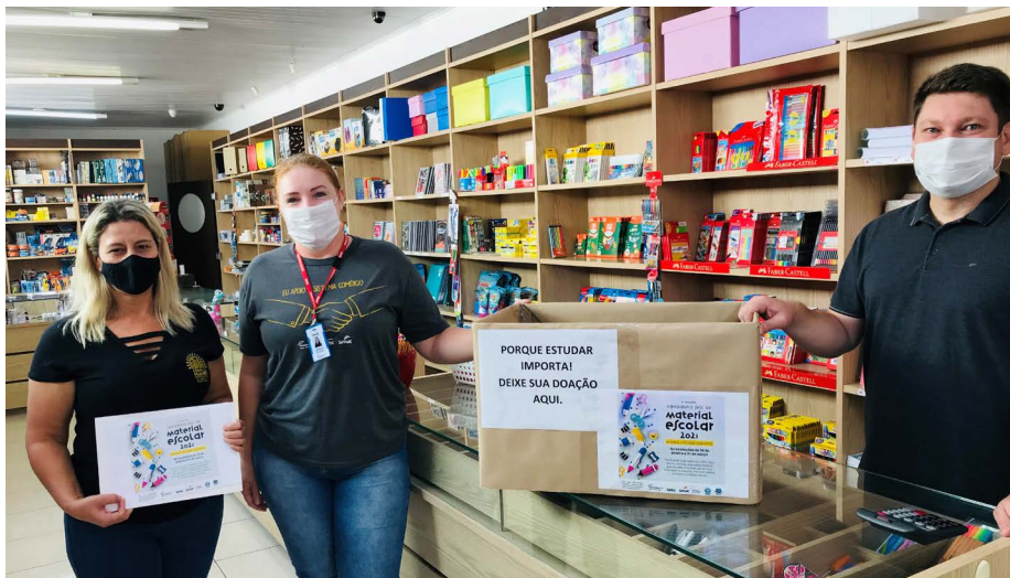
Lu Papelaria recebe doações da campanha em Prudentópolis

O material doado é destinado por meio da entrega direta as instituições sociais, com todas as atividades registradas e documentadas. As doações podem ser realizadas em todas as unidades do Sesc PR e do