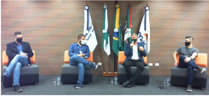
Desafios e Oportunidades no mundo da T.I., aula transmitida pela Faculdade Senac Curitiba Portão

Turmas de Gastronomia a Análise e Desenvolvimento de Sistemas começaram nesta segunda-feira