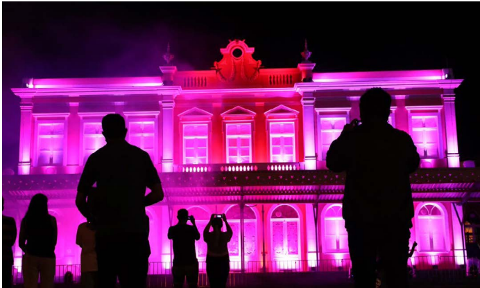
As luzes projetadas no prédio histórico da Estação foi um presente de Natal antecipado para quem passou pelo local