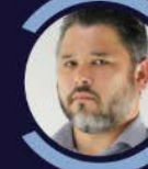
Everson Pinheiro Colbacho Roupas e Acessórios