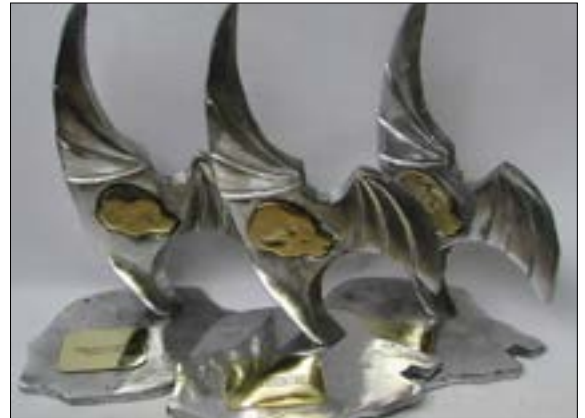
O troféu do prêmio é uma obra de arte criada e produzida pelo escultor Curitibaense Luiz Gagliastri

A decisão de divulgar antecipadamente os vencedores – tradicionalmente, o anúncio era feito em jantar festivo, no estilo Oscar, com participação dos três mais votados de cada categoria – foi tomada pela comissão de homologação do prêmio, em reunião realizada na semana passada. No mesmo encontro ainda acabaram aprovados encaminhamentos relativos à edição 2020 da premiação, a qual, diante da pande-