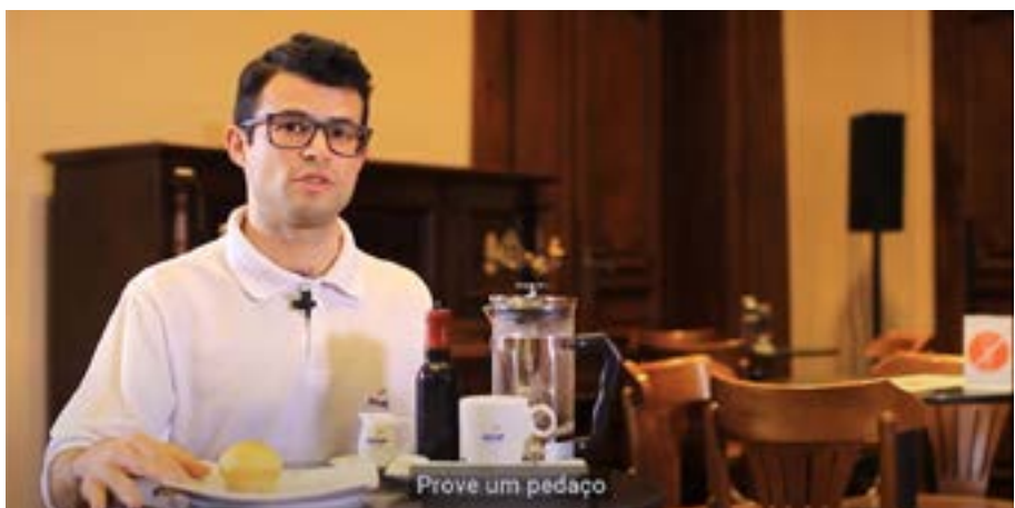
Workshop: A arte no preparo do café