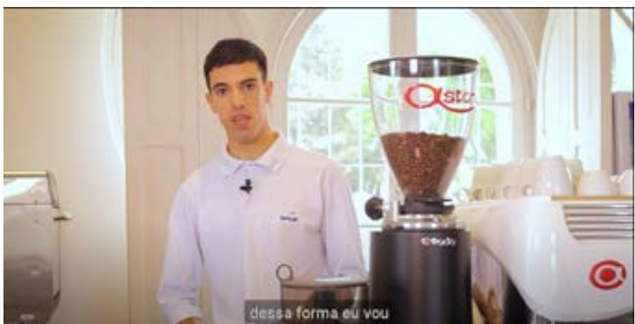
Workshop: Conquistando os clientes