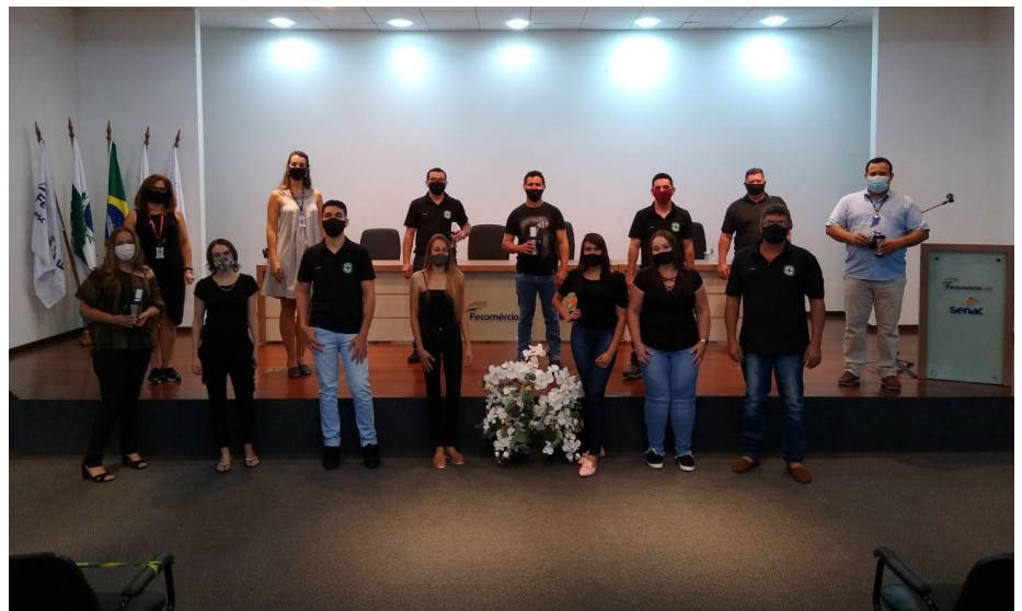
Alunos do Senac Cascavel na formatura da turma de Técnico em Segurança do Trabalho

O evento foi feito de acordo com os protocolos de segurança exigidos pelos órgãos de saúde, seguindo também o decreto Estadual.