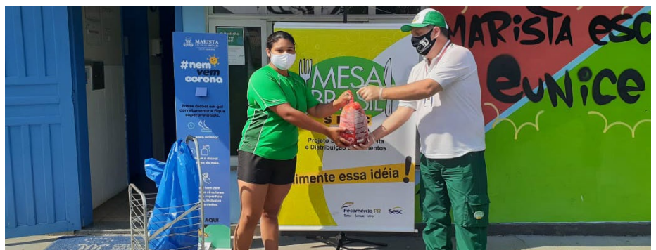
A escola Eunice Beunato foi uma das instituições que recebeu alimentos doados ao Mesa Brasil

O Mesa Brasil Parolin recebeu na quinta-feira (1) 9.324,270 quilos de carnes (peru, chester e pernil) provenientes da doadora nacional BRF. O repasse às instituições inscritas no programa foi realizado de 10 a 29 de setembro, sendo direcionado a 50 instituições que atendem famílias em situação de vulnerabilidade de Curitiba e região metropolitana, beneficiando 9.343 pessoas.