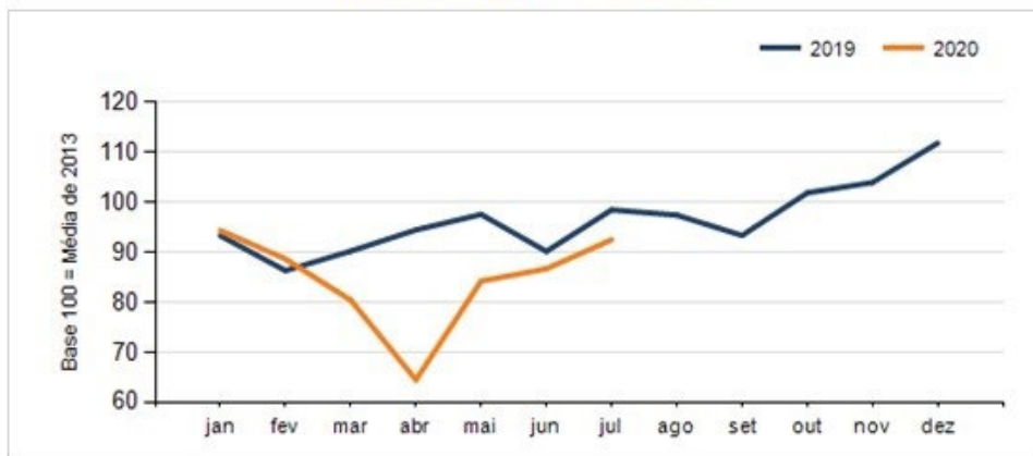
Evolução das vendas PARANÁ

No acumulado de janeiro a julho, o varejo paranaense registra redução de 9,11% nas vendas na comparação com igual período do ano passado. Já na comparação com o mês de julho de 2019, o movimento foi 6,08% menor.