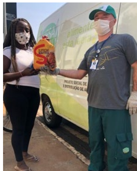
Doação realizada pelo Mesa Brasil do Sesc Maringá com produtos repassados pela parceria com a BRF

Mais informações sobre a Campanha Estadual do Mesa Brasil aqui.