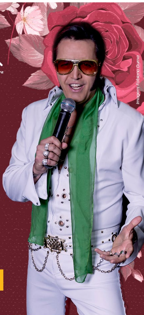
Imagem: Fabiano Guma