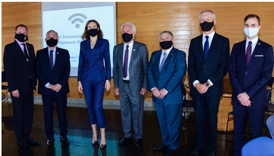
Reunião na Fecomércio PR com comitiva da República Tcheca

No período da tarde uma reunião no Palácio Iguazu foi realizada para a assinatura do Protocolo de Intenções