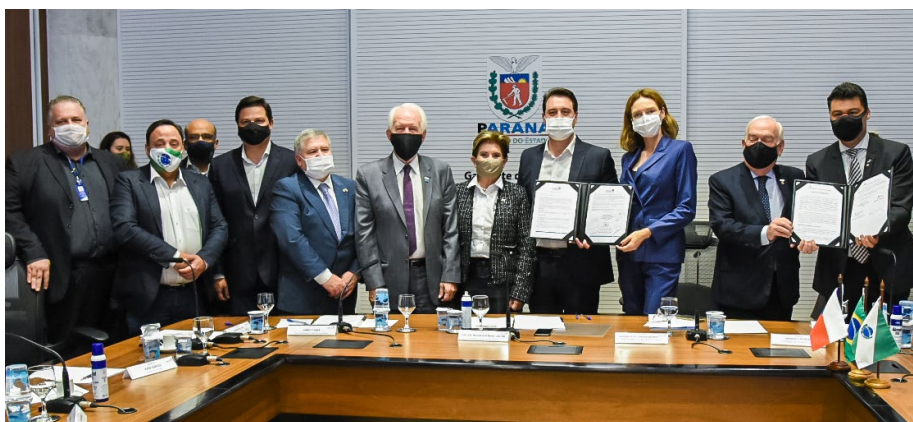
Assinatura do Protocolo de Intenções foi um dos pontos altos da reunião

entre a TatraBras, governo do Paraná e prefeitura de Ponta Grossa. A partir de agora está oficialmente celebrado o acordo para início da produção de caminhões no estado.