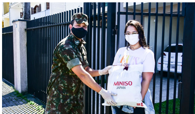
Atuação do Exército Brasileiro em parceria com as unidades de Curitiba, no bairro Boqueirão

O paranaense mostrou que a solidariedade pode ser exercida em tempos de isolamento social: centenas de pessoas saíram de suas casas e foram até as unidades do Sesc PR contribuir para o Dia D da 12ª edição da Campanha do Agasalho. Realizado no sábado (29) com segurança e comodidade, o evento permitiu que as doações fossem entregues no sistema de drive thru, disponível em 32 unidades de serviço do Sesc PR.