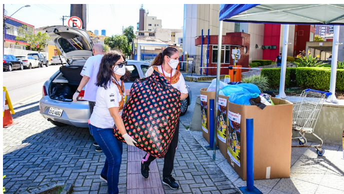
O Sesc da Esquina chegou a receber em média um veículo a cada meio minuto, no drive thru montado em frente à unidade