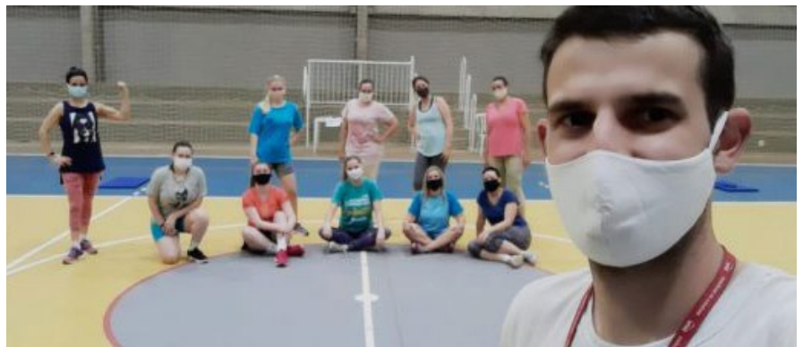
Academia do Sesc Marechal Cândido Rondon retorna aulas coletivas

A academia do Sesc Marechal Cândido Rondon retornou na semana passada, após a flexibilização do decreto municipal. As aulas coletivas acontecem nas terças e quintas-feiras às 19h, realizadas na quadra. A aula está sendo realizada na quadra esportiva da unidade, seguindo as medidas sanitárias para combater a propagação do COVID-19. É obrigatório o uso de máscara por todos os alunos e colaboradores do Sesc.