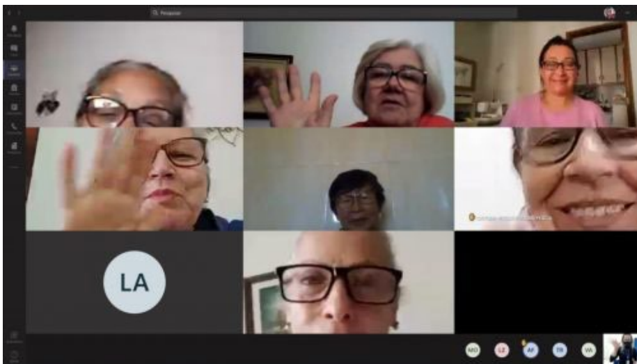
Integrantes do Grupo de Convivência do Sesc Londrina Centro realizam atividades online

O objetivo é retomar as ações do Grupo de Convivência através de encontros virtuais semanais com oficinas integrativas de memória e concentração, dança circular, respiração consciente, café virtual, bate papo com especialistas em diversas áreas, entre outras.