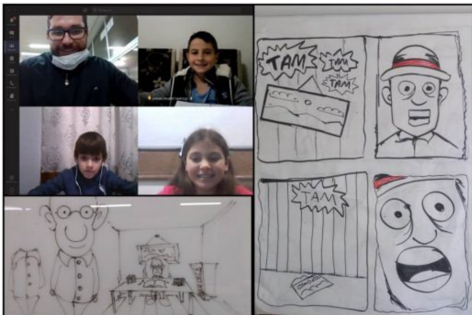
Alunos mostram suas ilustrações realizadas no curso de histórias em quadrinhos

Nos meses de julho e agosto o Sesc Francisco Beltrão desenvolveu o curso online de HQ – Histórias em quadrinhos módulo I. As aulas abordaram os principais fundamentos da arte, criação de personagem, desenvolvimento de roteiros e elaboração de estórias. Nessa semana será realizado o módulo II, em que os participantes irão colocar em prática o conteúdo teórico e aperfeiçoar suas habilidades.