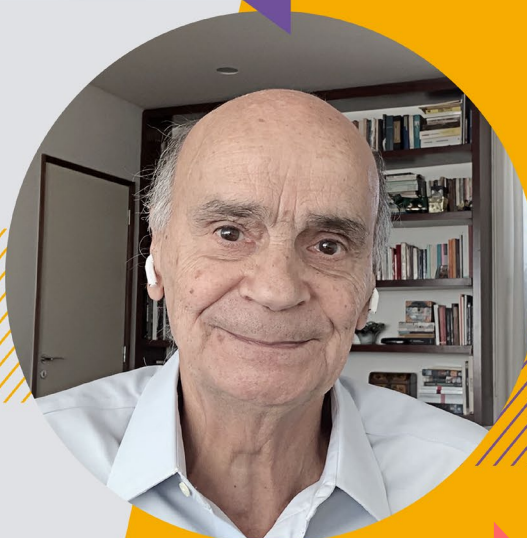
DR. DRAUZIO VARELLA