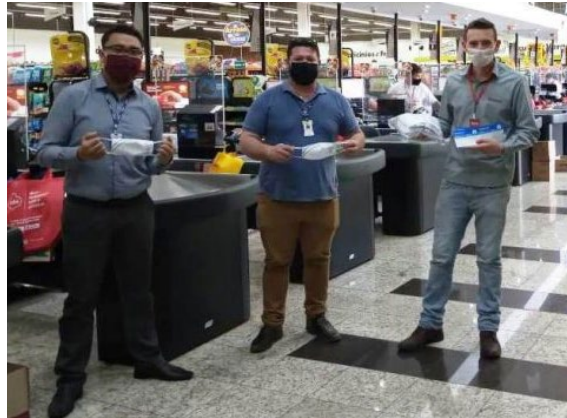
Gerentes executivos entregam máscaras em empresas do comércio

O Supermercado Superbaratão e o Hipermercado Paraná também receberam as doações das máscaras das mãos dos gerentes executivos do Sesc e Senac Ivaiporã. Segundo o gerente do Supermercado Superbaratão, esse é um momento de proteger os profissionais que estão na linha de frente, e não pararam suas atividades durante a pandemia nos serviços essenciais. “Eles estão aqui para atende