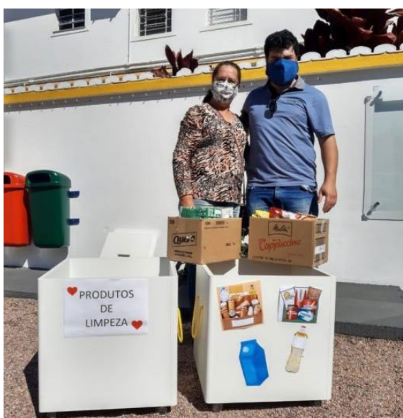
Educação Infantil do Sesc Portão realizou ponto de coleta de doações

A coleta das doações foi feita durante as edições do Drive Thru Solidário, em que as famílias dos alunos participaram das campanhas de arrecadação.