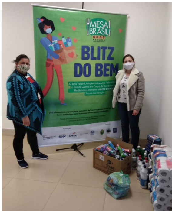
Colaboradores do Sesc Medianeira realizam as entregas arrecadadas na Blitz do Bem

Os itens foram destinados a quatro instituições cadastradas no Mesa Brasil. Foram recebidos 55 quilos de doações pelo Centro de Referência da Assistência Social (CRAS) Medianeira, ao Lar dos Idosos foram entregues 930 quilos, a Pastoral da Criança recebeu 890 quilos e à Sociedade Filantrópica Semear foram destinados 872 quilos de doações.