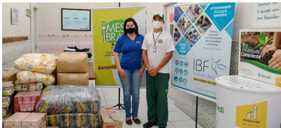
Entrega de doações feitas ao Instituto Beija-flor

O Festival Fome de Música é um projeto de shows musicais online, em que o público pode realizar doações. São artistas nacionais, produtoras, empresas e instituições que se uniram