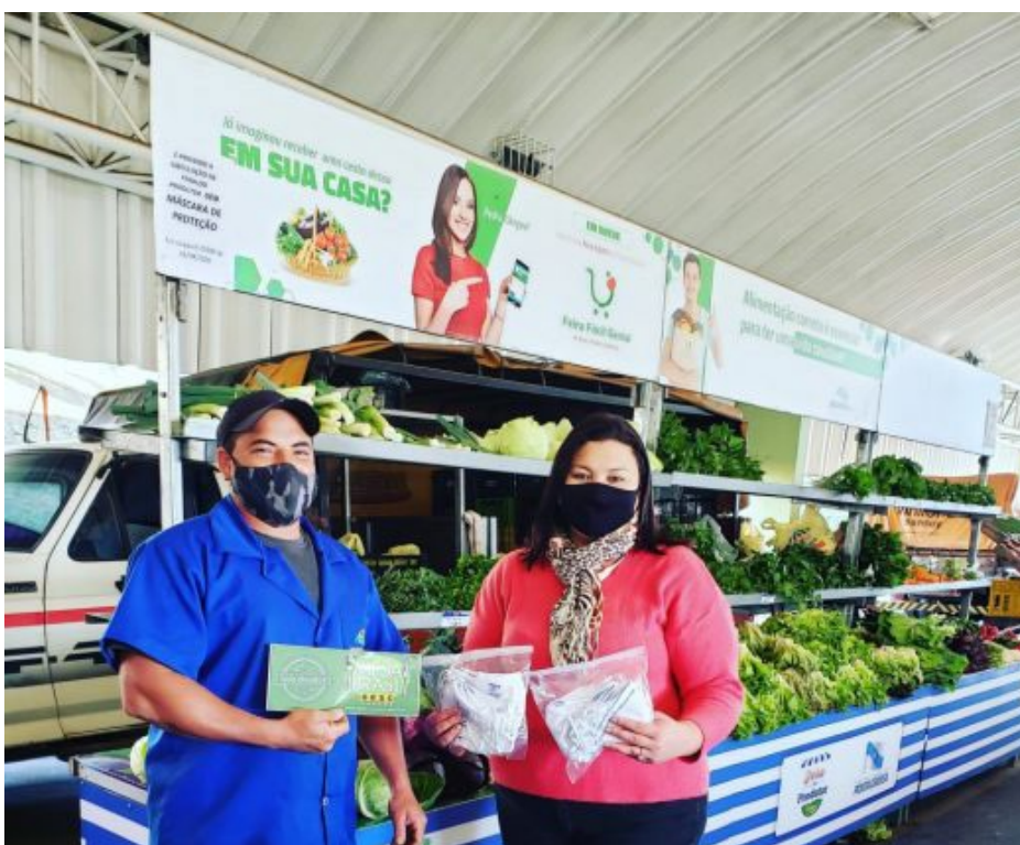
Outras 600 foram entregues em Ponta Grossa

De acordo com a unidade do Sesc, a ação reafirma o compromisso com a qualidade de vida e fortalece vínculos com seus públicos de relacionamento durante o período de emergência da pandemia.