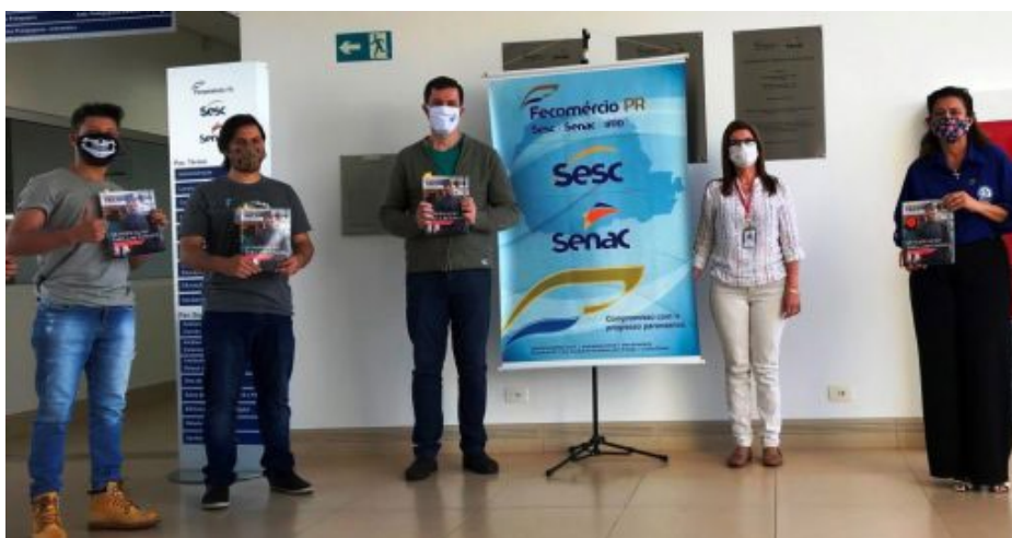
Doadores do Mesa Basil recebem Revista Fecomércio em Ivaiporã