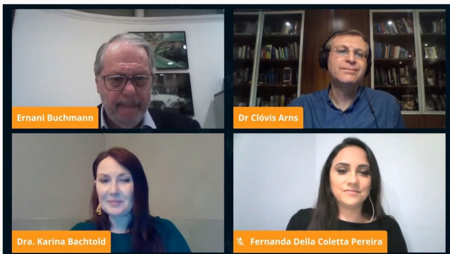
Live Desafios da Biossegurança em tempos do COVID-19 foi acompanhada online por alunos e instrutores do Senac PR

“O Senac PR já preparou milhares de profissionais com mão de obra especializada para o desenvolvimento do comércio. A pandemia tem imposto novos desafios, fazendo com que hábitos sejam revistos em todos os