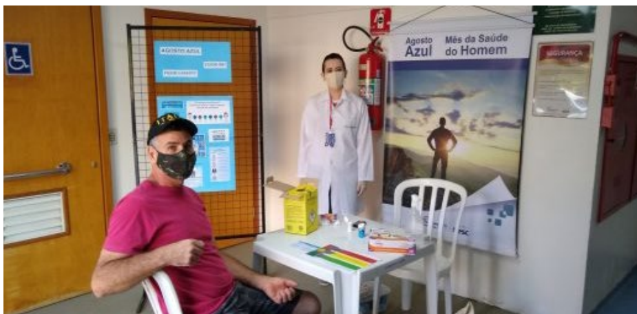
Ação em Cornélio Procópio

Para conscientizar sobre a importância dos cuidados com a saúde do homem, o Sesc iniciou a campanha Agosto Azul nas suas diversas unidades pelo estado. Exames gratuitos e orientações em saúde são feitas conforme a programação local. As medidas e cuidados para evitar a propagação da Covid-19 estão sendo tomadas, como o uso de máscara de proteção em acrílico pelos profissionais de enfermagem, luvas, álcool em gel e o distanciamento entre as pessoas.