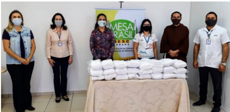
Oito mil máscaras distribuídas em Maringá e região

O Mesa Brasil do Sesc Maringá entregou oito mil máscaras, no dia 13, doadas pela empresa Dimatex Confecções de Paiçandu PR. Elas foram destinadas para quatro instituições da cidade e região: Associação Brasileira de Educação e Cultura (ABEC), em Paiçandu; Secretaria Municipal de Assistência Social de Sarandi; Albergue Santa Luiza de Marilac e Associação dos Amigos do Hospital Universitário Regional de Maringá. A doação atenderá aos assistidos pelas instituições, por meio desse ato solidário