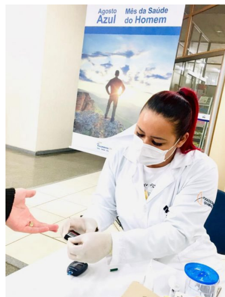
Exames e orientações em Guarapuava

A falta de cuidados com a saúde e o estilo de vida dos homens torna-os vulneráveis a doenças graves e crônicas, como: obesidade, doenças cardiovasculares, problemas gástricos, câncer de próstata e doenças relacionadas ao tabagismo (como câncer de pulmão, bronquite e enfisema).