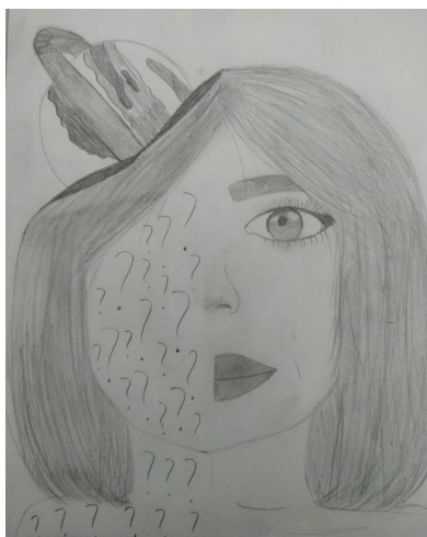
Autorretrato realizado por aluna durante aula do projeto Futuro Online