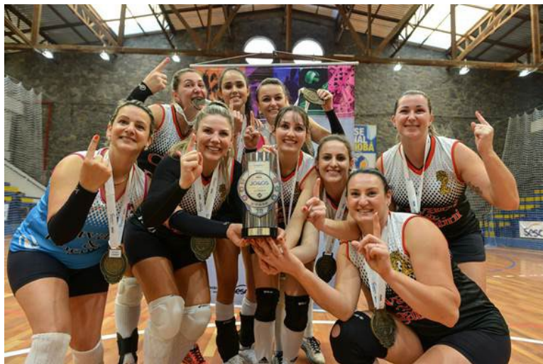
Inclusão de novas modalidades farão parte da edição 2021 do evento

Devido à pandemia do Covid-19, o evento será realizado novamente em 2021. Novidades estão previstas para a próxima edição, como a inclusão das modalidades: Basquete 3x3, Bets, Canastra, Fifa, Futevôlei, Futmesa, Gincana e Sinuca. Outra atualização dos Jogos é a participação de colaboradores do Sesc PR, que a partir do