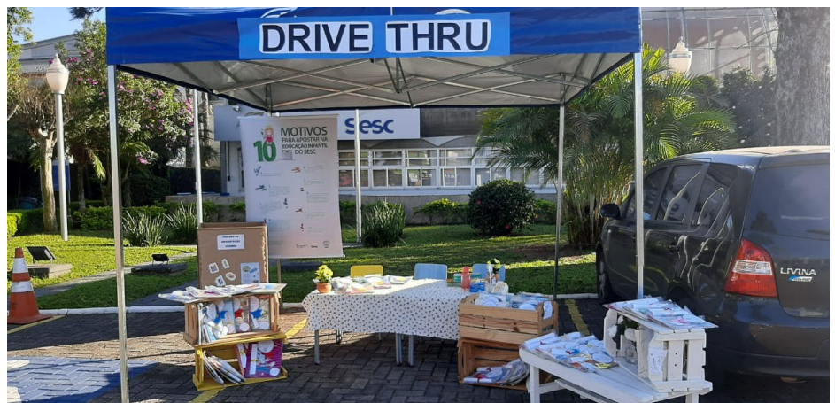
Sesc Portão realiza Drive Thru com o empréstimo de livros para os alunos da Educação Infantil

Na quinta-feira (23) a Educação Infantil do Sesc Portão realizou a 3ª edição do Drive Thru Solidário. O objetivo da ação é coletar produtos de limpeza e higiene pessoal para doação e proporcionar atividades para os alunos realizarem em casa. Com a participação de 62 famílias, foram arrecadados 160 kg de alimentos, 730 peças de agasalhos e 64 itens de produtos de higiene. Nesta edição do Drive Thru, as crianças puderam realizar empréstimos de livros para ler em casa.