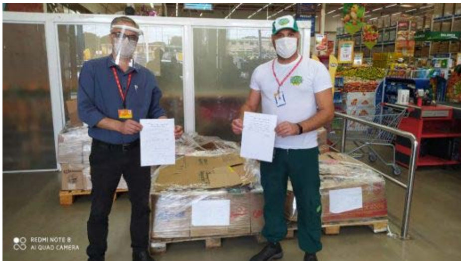
A empresa atacadista já doou mais de dois mil quilos de produtos para a iniciativa

De 16 de abril, quando foi iniciada, até ontem (18), a campanha es-