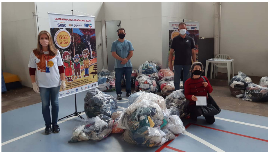
Colaboradores do Sesc Portão com as doações recebidas

Na quarta-feira (17) foi realizada a entrega das doações da Campanha do Agasalho no Sesc Portão. Os itens arrecadados foram destinados para a Associação dos Deficientes Visuais do Paraná (ADEVIPAR), Associação Beneficente de Mãos Unidas, Instituto Decisão de Apoio Social (IDAS) e Casa de Apoio Abibe Isfer, todas as instituições parcerias indicadas pelo Instituto GRPCOM. Até o momento foram triadas 15 mil peças, continuando a entrega das doações para os municípios de Doutor Ulysses e Itaperuçu. A Campanha do Agasalho segue até 31 de agosto.