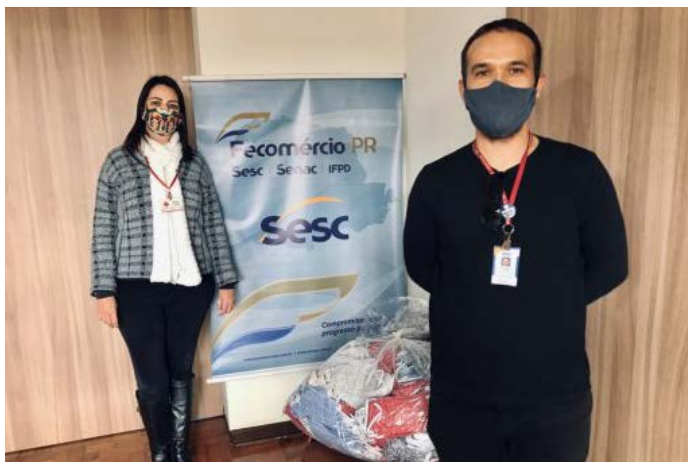
A Cáritas Arquidiocesana de Londrina foi uma das beneficiadas