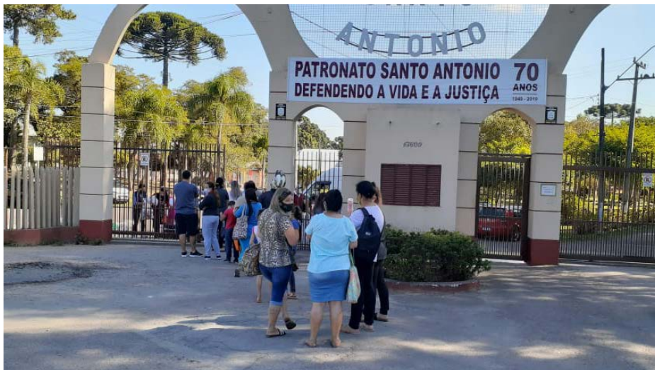
Entrega realizada no Patronato Santo Antônio, em São José dos Pinhais

Desde o dia 16 de abril o Sistema Fecomércio Sesc Senac PR e as empresas de comunicação do Paraná estão engajados na campanha estadual de arrecadação de alimentos não perecíveis, produtos de higiene pessoal e de limpeza, álcool em gel, luvas e máscaras. Receptor das doações, o programa Mesa Brasil do Sesc PR tem distribuído esses itens às entidades assistenciais cadastradas. Até o dia 19 de maio 35 mil kg de produtos foram arrecadados, o que demonstra o envolvimento de todas as unidades do Sesc PR e dos parceiros, além da solidariedade dos paranaenses.