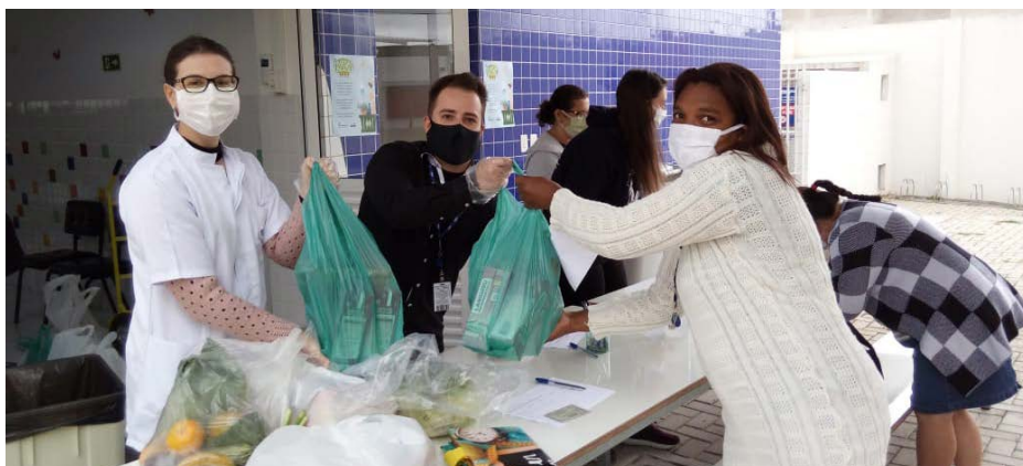
As famílias assistidas pela Instituição Irmão Henri, localizada no município Fazenda Rio Grande, foram beneficiadas com as doações da campanha

O Mesa Brasil do Sesc de Campo Mourão recebeu 50 máscaras de tecido, doadas pela empresa Arte Final. Os itens serão destinados às instituições cadastradas pelo programa na cidade e na região. O programa também tem repassado sistematicamente doações para a Secretaria Municipal de Ação Social do município. Ao todo, 1.600 kg de alimentos foram destinados para aproximadamente cinco mil famílias