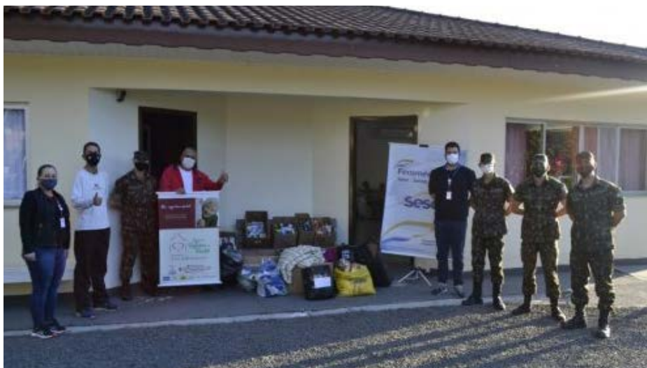
Entrega realizada pelo Sesc União da Vitória em parceria com o 5º Batalhão de Engenharia de Combate Blindado

Também em 11 de maio, o Sesc Paranavaí realizou a entrega de alimentos arrecadados durante a campanha para o Grupo Gotas de Esperança (GOES). A doação foi realizada por