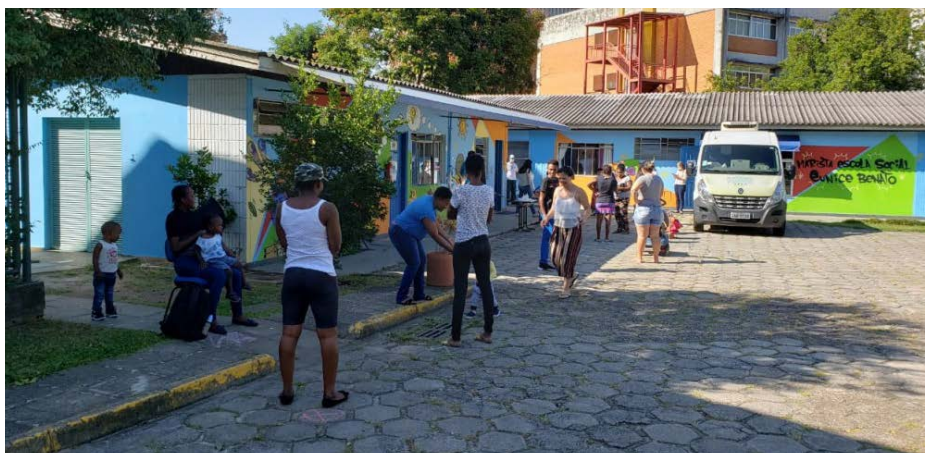
Entrega realizada em Curitiba no Centro Educacional Marista Irmã Eunice Benato

O Programa Mesa Brasil Sesc Maringá busca evitar o desperdício